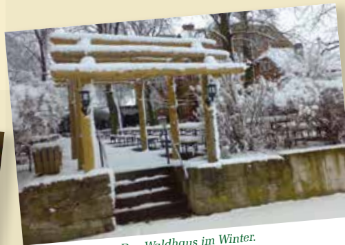
Das Waldhaus im Winter.