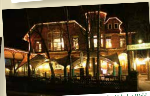
Zur jeder Tageszeit, von 11.00 bis 24.00 Uhr, lädt das Waldhaus zu Speis, Trank, Beisammensein und schönen Stunden.