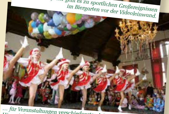
... für Veranstaltungen verschiedenster Art. Hier wird im Ballsaal unterm Kronenleuchter riesig Fasching gefeiert, ...

Besuchen Sie uns auch in Leipzig in der Brauerei an der Thomaskirche!