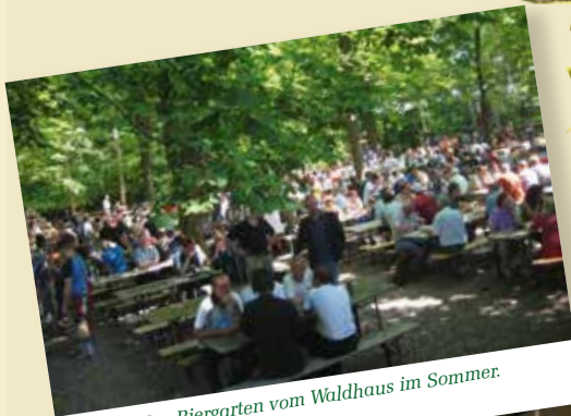
Der Biergarten vom Waldhaus im Sommer.