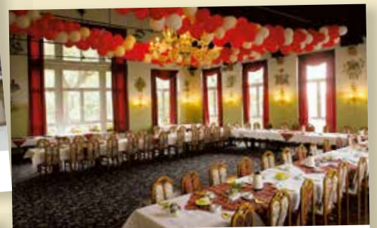
Im großen Saal stehen 200 Plätze für Hochzeiten, Jubiläen, Feste, aber auch Tagungen und Konferenzen zur Verfügung.