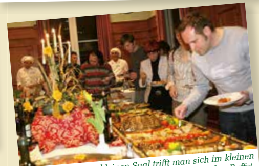
... nebenan im kleinen Saal trifft man sich im kleinen Rahmen oder lädt zum großen Buffet.