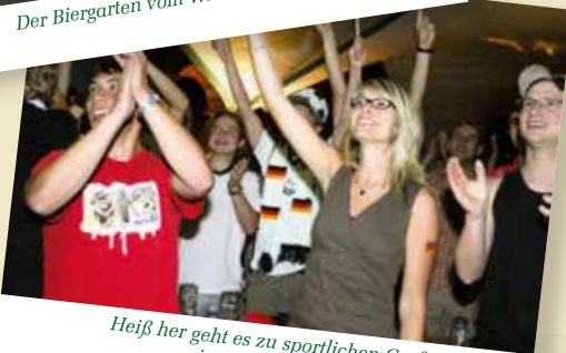
Heiß her geht es zu sportlichen Großereignissen im Biergarten vor der Videoleinwand.